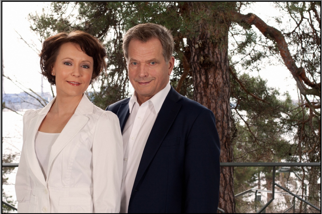
Tasavallan presidentti Sauli Niinistö ja rouva Jenni Haukio Cantores Minores -kuoron koko toiminnan pysyvät suojelijat (1.3.2012- )